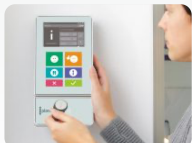
Individuelle Bedruckung der Front am EVO 4.3. Individual printing on the front EVO 4.3.